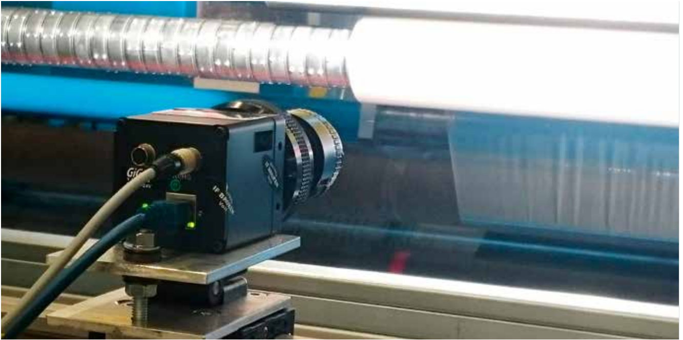
Folie fest im Blick: Da der Arbeitsabstand der Kamera zur Folie fix ist, variiert je nach Rollenbreite und Zuwachs des Rollendurchmessers während der Produktion die Größe des vom Bildverarbeitungssystem auszuwertenden Bereichs